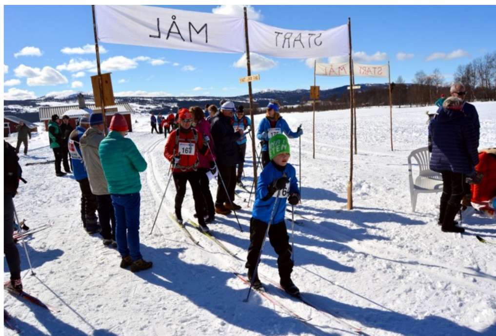
Det blir påskeskirenn på Langestølen langfredag.